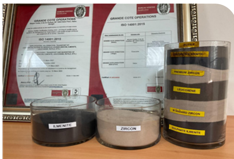
Photo prises dans le bureau de la GCO avec des extraits de Gircon

Dans d'autres cas, un système de « bourse » est mis en place, offrant une compensation financière aux impactés. Par exemple,