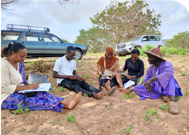
Photos prises au cours des entretiens avec les populations impactées

L'équipe du projet a effectué une mission exploratoire dans l'arrondissement de Méouane en août 2024. Elle a, dans ce cadre, rencontré plusieurs acteurs à la base afin de s'imprégner du contexte des investissements dans la zone, du niveau d'opérationnalisation de la charte de gouvernance foncière et des cadres de concertations existants.