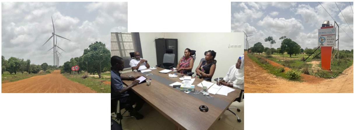
PARC Eolien de Taïba Ndiaye