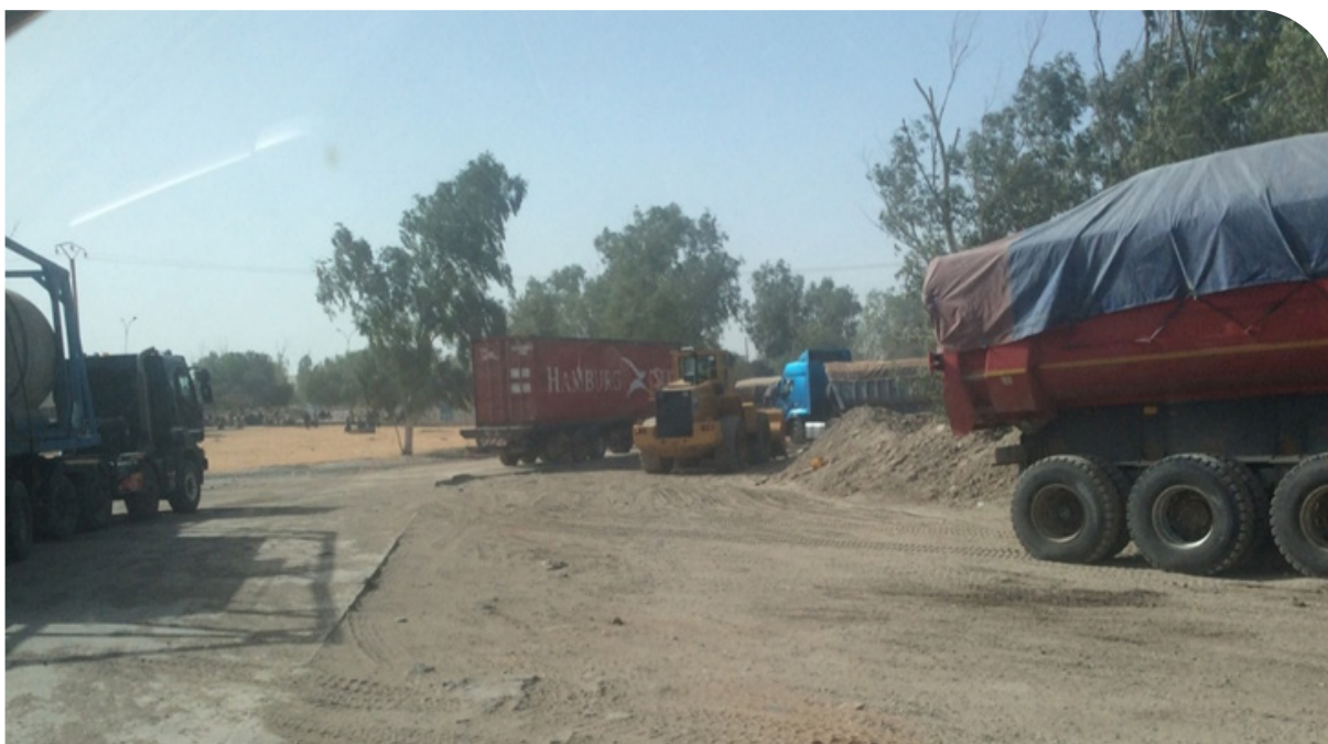
Camions des ICS à Darou Khoudoss

De plus, la perte d'arbres fruitiers, source de revenus annuels substantiels, est souvent compensée par des montants forfaitaires dérisoires. Un acteur de la société civile locale explique :