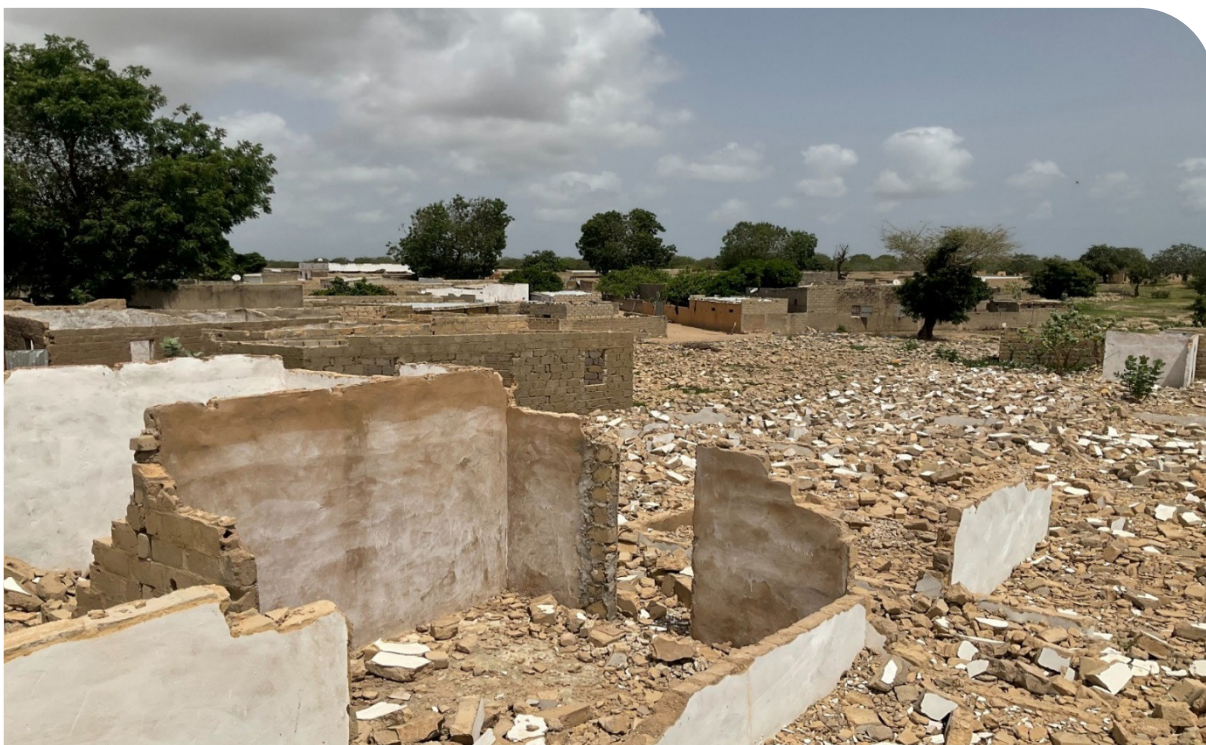
Village déplacé de Médina Fall

localité. Par exemple, une autorité locale de Taïba Ndiaye relève la difficulté à constater des embauches locales, malgré l'envoi régulier de données sur les besoins.