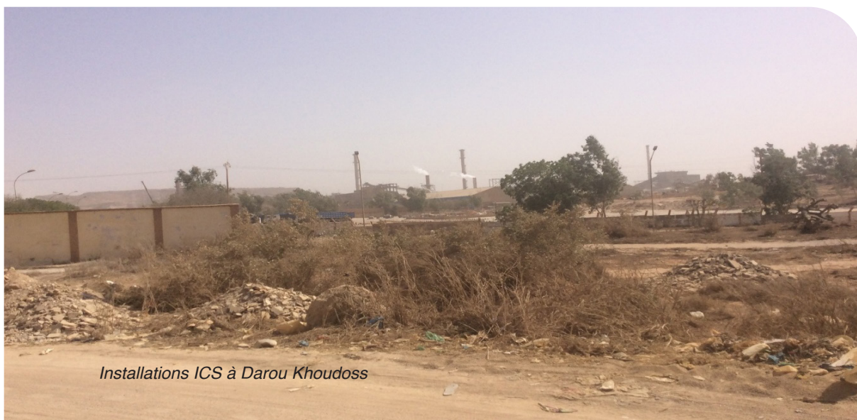
Installations ICS à Darou Khoudoss

« Cette pollution affecte non seulement les communes situées à proximité de l'entreprise, mais elle est également observée jusqu'à Tivaouane. En conséquence, les populations souffrent fréquemment de maladies pulmonaires, notamment des infections respiratoires aiguës (IRA). »