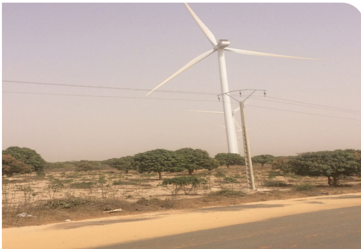
Le parc éolien de Taïba Ndiaye

Il s'agit ainsi d'un trafic intense qui au-delà de la pollution pose d'autres défis à la localité (voir ci-dessous).