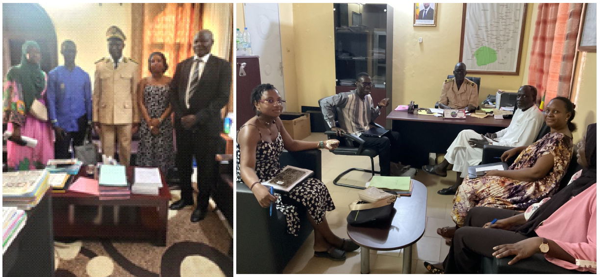
Entretien avec les autorités locale : le Préfet du département de Tivaouane et le Sous-préfet de l'Arrondissement de Méouane