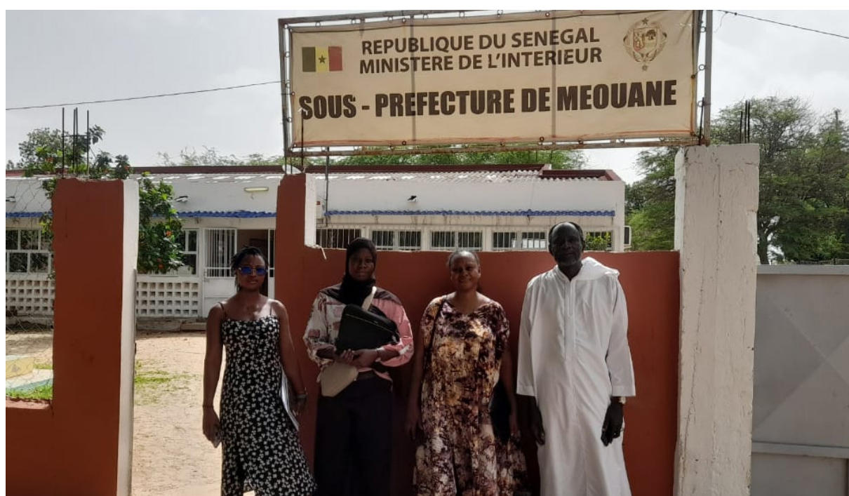
Sous-préfecture Méouane, Photo prise au cours des entretiens lors de la phase exploratoire

Les formations offertes aux populations locales constituent une autre dimension importante de la RSE. Par exemple, le Parc Éolien propose des formations sur la transformation des céréales locales et en pâtisserie, fournissant ensuite le matériel nécessaire. Ces formations ciblent souvent les femmes, visant à renforcer leurs compétences et leur autonomie économique. Cependant, la mise en œuvre de la RSE est confrontée à plusieurs défis, notamment le manque de ressources humaines et financières pour assurer le suivi des activités, la difficulté à impliquer toutes les catégories de la population (jeunes, femmes), et l'absence de synergie entre les différentes parties prenantes. Les activités RSE dans les entreprises ciblées sont énumérées dans le tableau ci-dessous.