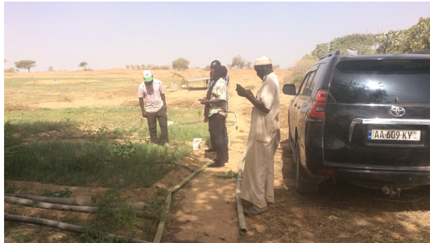
Agriculteurs affectés par les activités des ICS