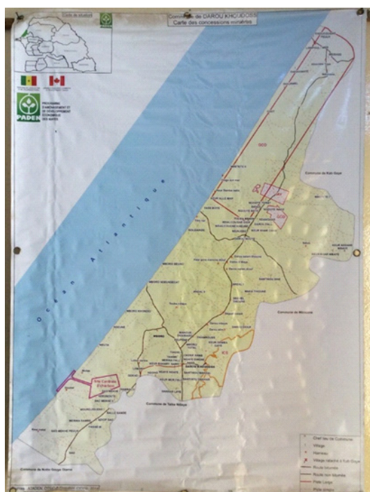
Carte 2 : Localisation des entreprises extractives dans l'arrondissement de Méouane

L'arrondissement de Méouane est confronté à des enjeux fonciers liés à l'expansion des investissements industriels, dans les secteurs extractifs et énergétiques. Historiquement réputée pour son potentiel agroécologique, la localité a été marquée ces dernières années par l'implantation croissante d'industries exerçant une pression accrue sur les terres agricoles, menaçant la durabilité des activités traditionnelles et la préservation des espaces naturels.