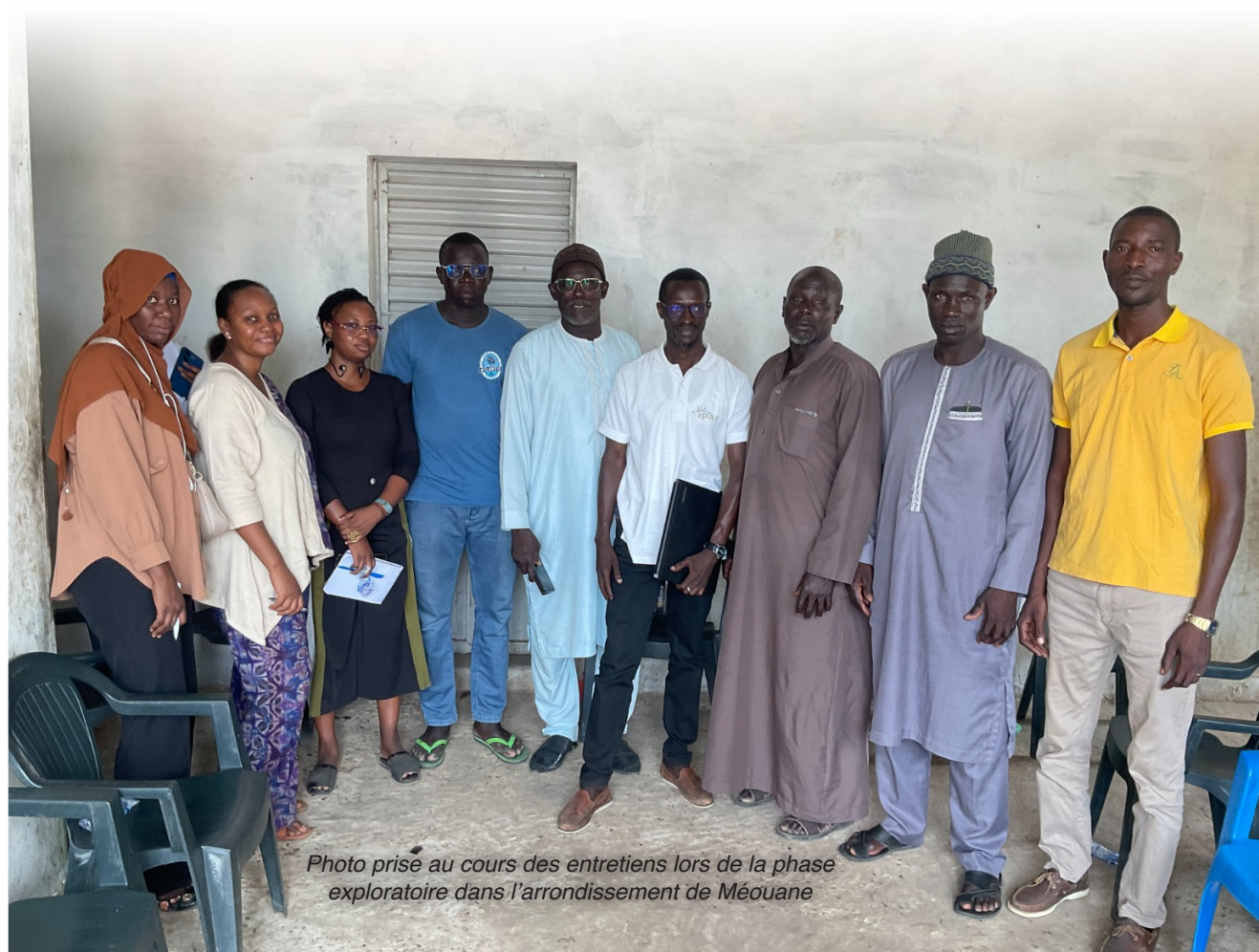
Photo prise au cours des entretiens lors de la phase exploratoire dans l'arrondissement de Méouane

Face à ces défis, des initiatives ont été mises en place, telles que la création de cadres de concertation, afin de promouvoir une gouvernance foncière inclusive et durable. Celles-ci ont permis des avancées dans la gestion du foncier, mais elles restent confrontées à des défis pratiques, notamment l'élaboration de stratégies communes pour une utilisation équilibrée des terres. Il s'agit de concilier le développement économique et la préservation des activités agricoles traditionnelles, tout en assurant une participation effective des populations locales aux processus décisionnels.