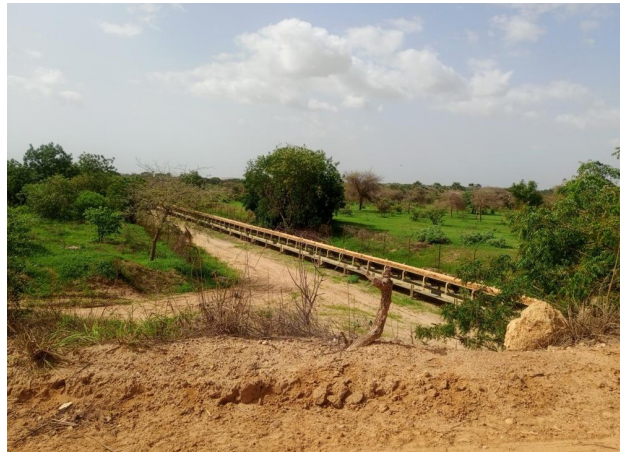
Photos prises devant le bureau des ICS