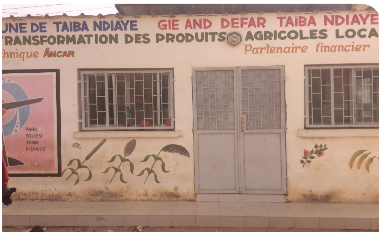
GIE soutenu par le Parc éolien à Taïba Ndiaye

Les entreprises minières et énergétiques de la zone, telles que les ICS, GCO, et le Parc Éolien, mettent en œuvre diverses initiatives RSE à travers lesquelles elles collaborent avec les populations pour leur mise en œuvre. Il s'agit donc de formes de partenariat guidées par la mise en œuvre d'actions ponctuelles qui ne s'inscrivent pas toujours dans la durée.