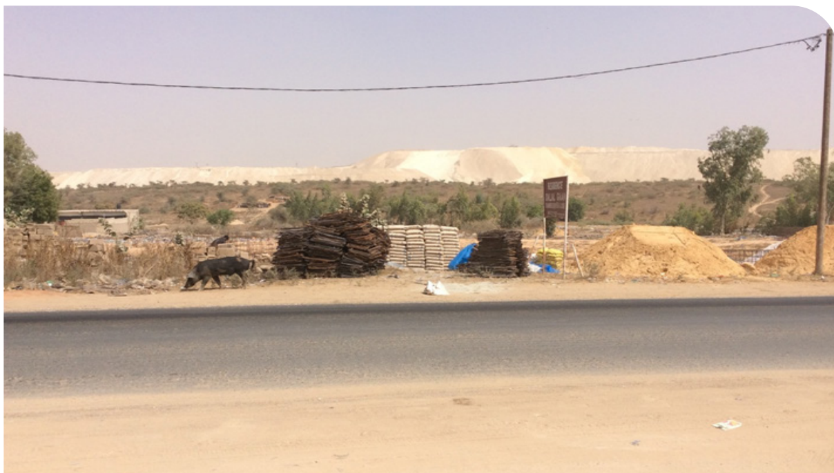
Occupation de parcelles agricoles par les ICS

L'un des canaux principaux de l'apport financier réside dans le paiement des taxes locales par les entreprises. Ces contributions fiscales constituent une source directe de revenus pour les mairies. Il s'agit de ressources potentiellement utilisables pour financer des services publics locaux et des projets de développement.