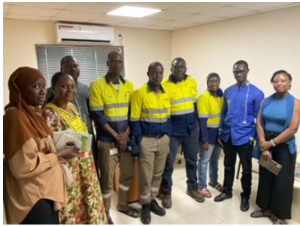
Photos prises dans les bureaux de la GCO