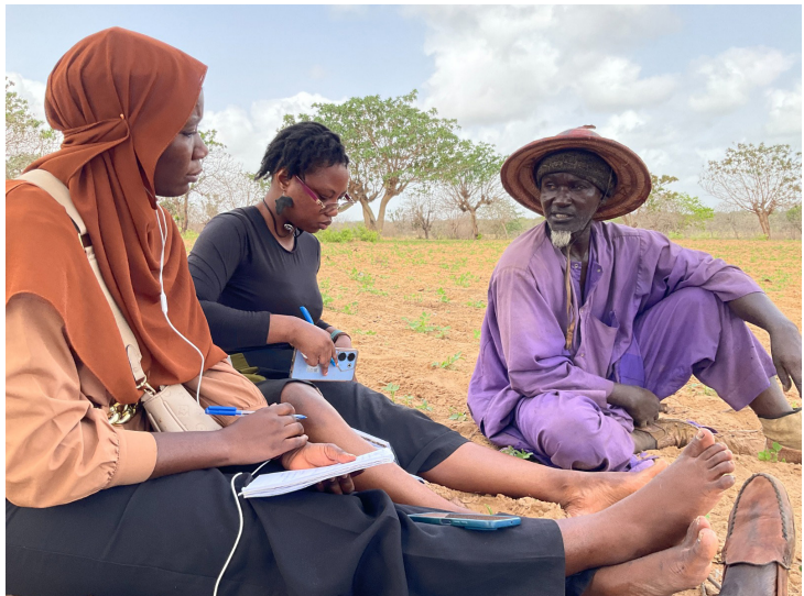
Photos prises au cours des entretiens avec les populations impactées