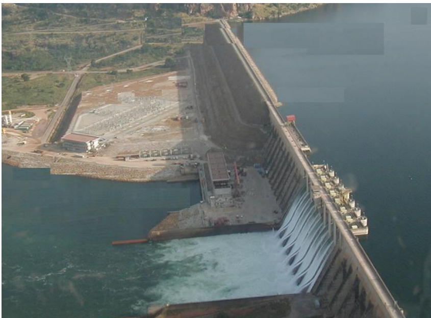
Manantali Barrage hydro-électrique