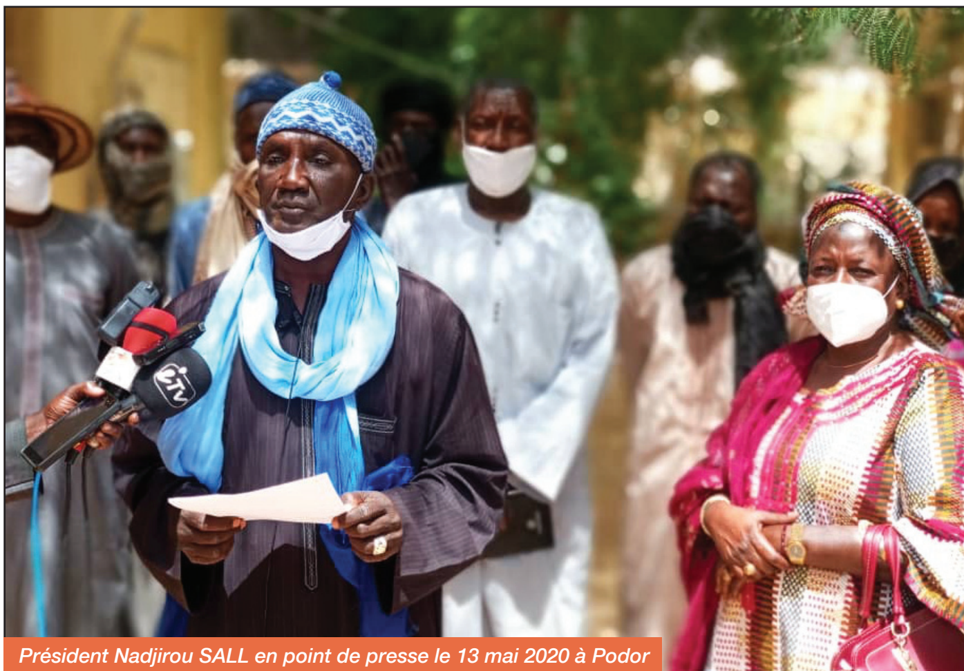
Président Nadjirou SALL en point de presse le 13 mai 2020 à Podor